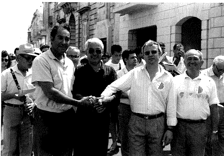
Uffiċjali taż-żewġ baned flimkien