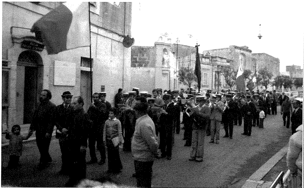
Meta Malta saret Repubblika