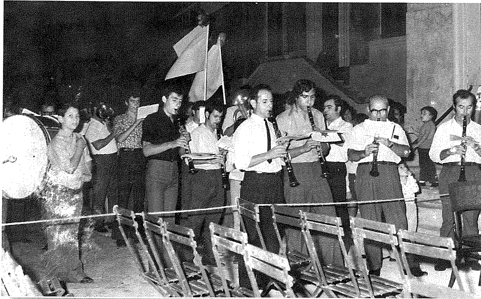
Meta l-Gudja United rebħu l-promozzjoni għat-tieni diviżjoni fil-league tal-M.F.A.