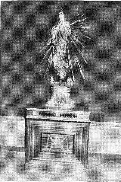
Il-Vara ta' Marja Bambina

Il-korsija tal-knisja ma ntmisix. Imma l-artal iddahhal 'il ġewwa u żdiedu żewg kappelluni. B'hekk saret bi stil ta' salib latin. Inbnitilha wkoll koppla. Il-lewn hamrani ta' l-iskutella tagħha jidher hafna anki mil-bogħod. Bil-għajnuna ta' benefatturi u mill-ġbir tal-poplu saru l-opri ta' llum. Minn ta' l-imghoddi l-knisja ma fadlihiex hlief il-kwadru titolari. L-artal tal-ġebel li kien hemm qabel ma tkabbret kellu zieda ta' l-injam għall-festa. L-iskannell tiegħu kien magħmul f'ghamla ta' taraj. Fuq it-tliet tarġiet għal kull naha kienu jitqegħdu l-gandlieri. Dan l-artal sar meta l-knisja tkabbret u kien fil-post fejn illum hemm l-artal