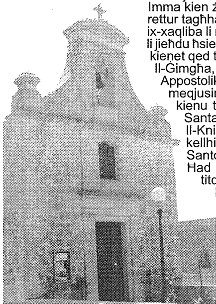
Sta. Katerina tad-Dahla

Dusina ordna li l-knisja tiġi magħluqa għal kollox. Il-kwadru ta' Santa Katarina kellu jittiehed fil-knisja parrokkjali ta' San Pawl, u jitqiegħed fejn jidhirlu r-Rettur ta' din il-knisja. Ir-Rettur ta' San Pawl kellu jieħu hsieb li jqiegħed ma l-artal ta' Santa Katarina ventartal tal-ġild u żewġ gandlieri. Zdiegħ ukoll l-obbligu tal-quddiesa stabbilita. Mill-gebel tal-knisja kkundannata seta' jsir użu għall-bini ta' knisja ġdida, skond fejn ir-Rettur ikun jidhirlu. 2