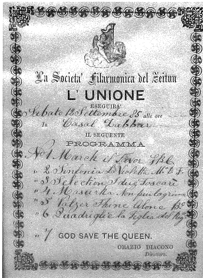
Għaqda Banda Żejtun Manifest Festa Casal Zabbar

Din bit-tajjeb u bil-ħażin damet għaddejja għal bosta snin li matul din il-firxa mhux darba jew tnejn kien sar sforz biex tiġi mibdula għal dahra ta' Banda u mal-medda giet imwaqqfa l-Banda del Zejtun sabiex tiehu parti wkoll fil-gilwa tal-Ġimgha l-Kbira, li kienet digà magħrufa fil-lokalità u l-irħajla tal-madwar ta' min wiehed ikun jaf ukoll li f'dik il-ħabta l-Monument bi