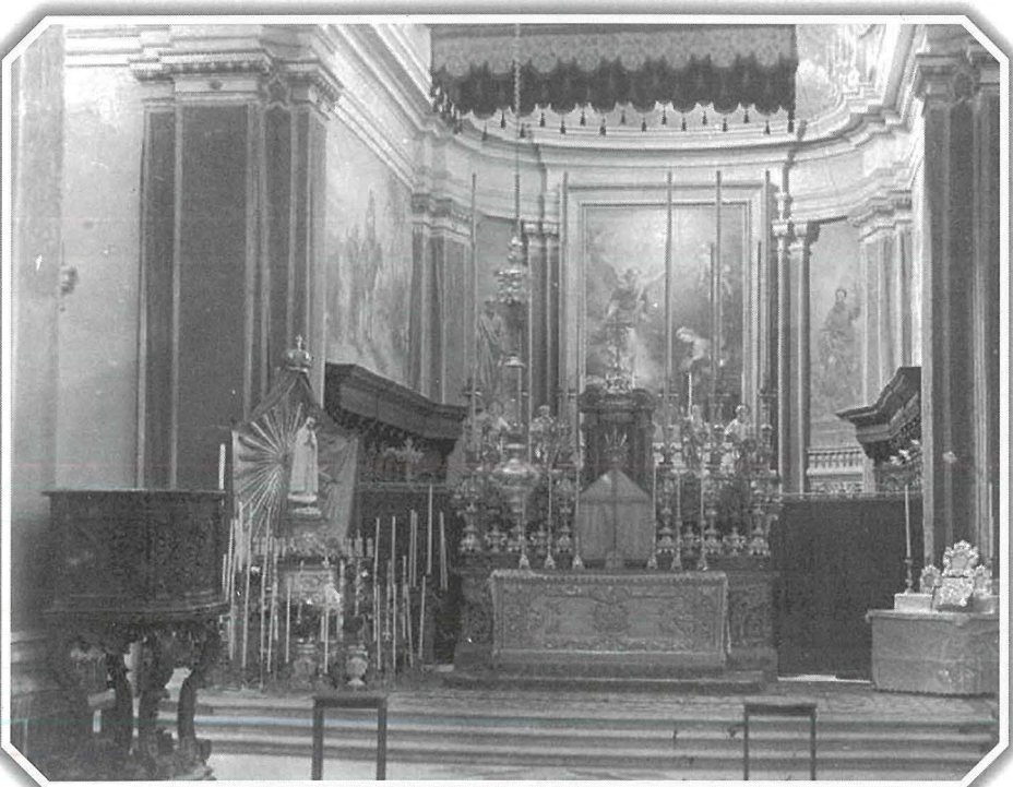
Dehra ġenerali tal-korsija tal-knisja bil-pulptu prominenti mal-ewwel pilastru. Ritratt meħud fl-1949 waqt il-miġja tal-Madonna ta' Fatima fil-parroċċa.