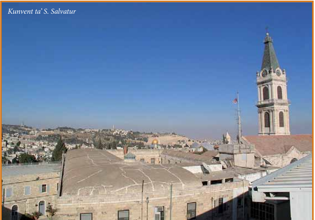
Kunvent ta' S. Salvatur

L-aħjar soluzzjoni kienet tidher li tkun dik li tittawwal