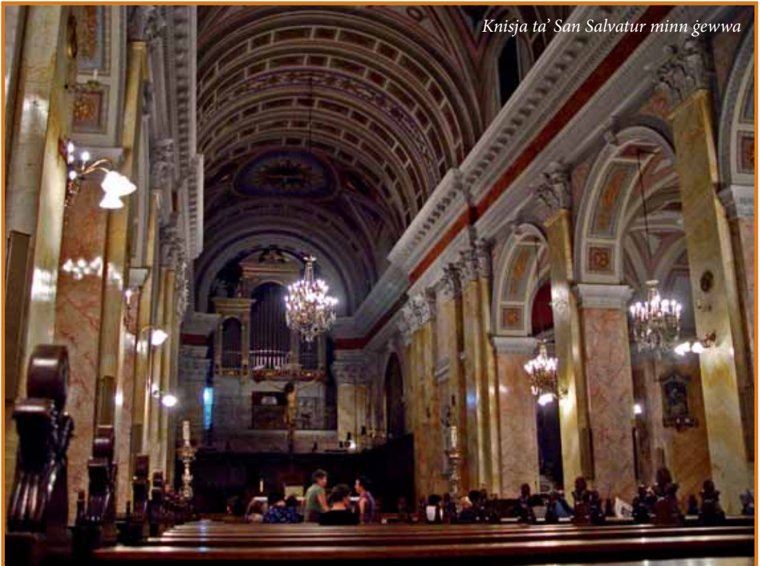
Knisja ta' San Salvatur minn ġewwa

Kif rajna, f'Novembru 1869, l-Imperatur tal-Awstrija Franz Josef intebaħ personalment bl-"insuffiċjenza" tal-Knisja ta' San Salvatur. Ta' min iżid li din l-"insuffiċjenza" ma kinetx biss f'relazzjoni mal-parroċċa, imma wkoll