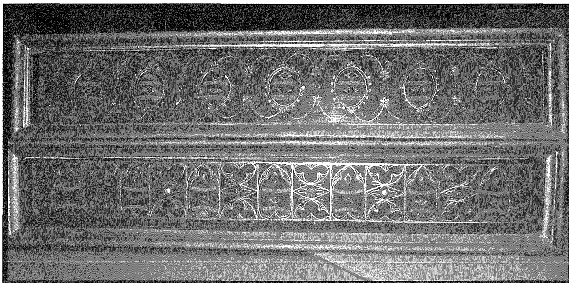
Relikwi ta' diversi qaddisin fil-Knisja Parrokkjali ta' Hal Tarxien

Hija t-triq tal-Vangelu. Fil-qaddisin għandna naraw dawk il-virtujiet sbieħ li kellhom meta kienu fuq din l-art, bħal: penitenza, sabar, imħabba, kastità, fidi, tama,