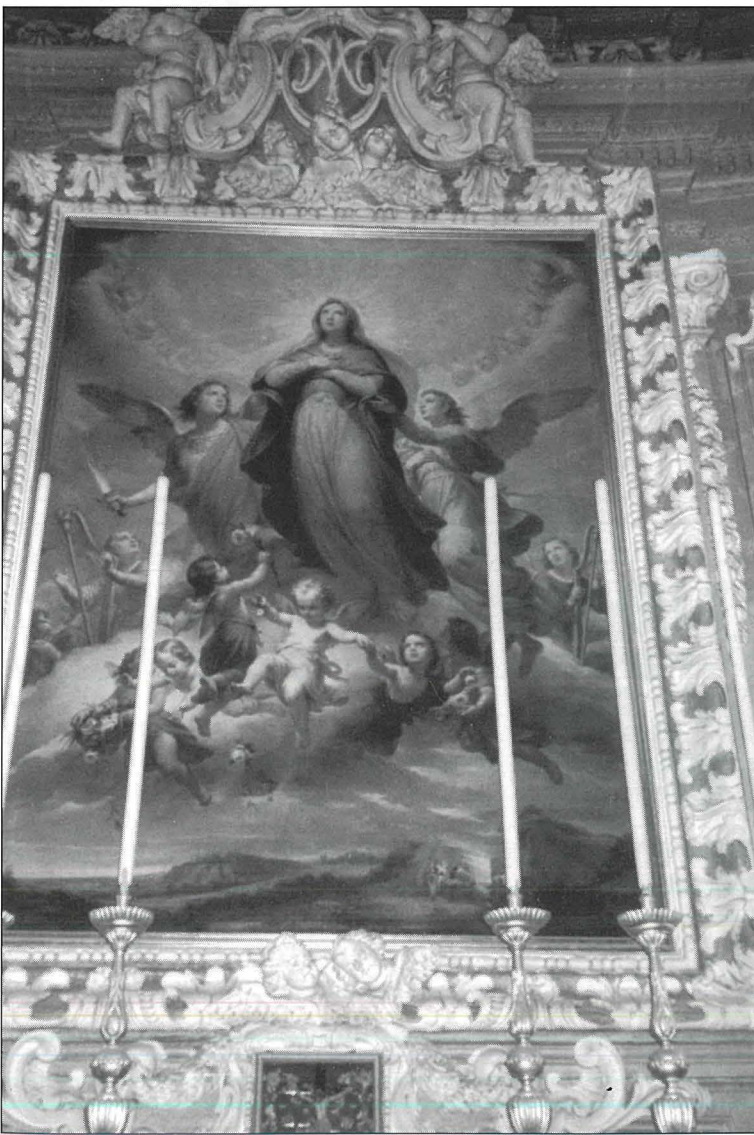
It-titular tal-Knisja Parrokkjali tal-Gudja ta' Pietro Gagliardi li sar fl-1877

Il-Knisja parrokkjali arċimatriċi ta' Hal Tarxien hija mzejna b'diversi opri artistici. Waħda minn dawn l-opri hi l-inkwadru titulari tal-Lunzjata. Dan hu xogħol ta' Pietro Gagliardi (1809-1890).