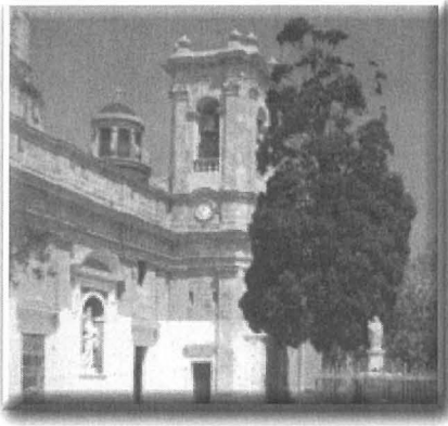
Dehra minn barra tas-Santwarju tal-Mellieħa.

Madankollu hemm diffikultà biex isir studju dwar din l-ikona, għall-fatt li biċċa kbira mill-pittura diġà hija mitlufa u ma setgħetx tintbagħat barra għal aktar