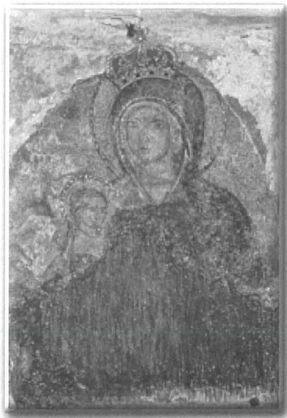
Ix-xbieha mirakoluża tal-Madonna tal-Mellieħa (inkurunata fl-24 ta' Settembru 1899).

Post ta' devozzjoni bħalma hu s-Santwarju tal-Mellieħa bi storja bħal din warajh, ċertament li jixraqlu titlu aktar dinjituż minn dak ta' Santwarju.