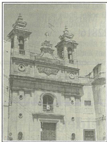
Il-faċċata tal-kappella imsejha "ta' Ċelju".