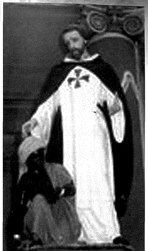
San Felic de Valois

is-simbolu ta' trinitarji. Fil-festa titulari tagħna hdejn il-bieb prinċipali tal-knisja parrokkjali jiġu armati l-istatwi ta dawn iż-żewġ qaddisin Trinitarji fuq il-pedestalli. Lil San Felic de Valois nsibuh biċ-ċerv hdejn saqajh u fuq rasu ċ-ċerv, bejn il-qrun hemm is-salib aħmar u blu u dan l-istess salib jinsab fuq fil-libsa bajda fuq sider dan il-qaddis. L-istatwa ta' San Gwann de Matha turi lil dan il-qaddis liebes l-istess libsa tat-Trinitarji bis-salib aħmar u blu fuq sidru u jħares lejn wieħed mill-iskjavi marbut bil-ktajjen. Dawn l-istess qaddisin u oħrajn Trinitarji insibuhom impittrin fil-lunetti tal-ġnub tal-knisja u jiddomina fuqhom is-salib Trinitarju bil-kuluri aħmar u blu. Dan is-salib insibuh fuq it-terħa ta' l-artal maġġur, fl-apparat tal-festa, fuq l-orgni u f'bosta hwejjeġ oħra. Dawn il-kuluri ta' l-aħmar u l-blu saru ukoll il-kuluri tal-Marsa li jiddistingwuna minn irħula u bliet oħra. Il-kuluri narawhom ukoll f'arma tal-Marsa u anke iddaħlu f'arma tal-Kunsill Lokali. Ma jistax jonqos li anke f'arma ta' l-Għaqda Festi Esterni SSma. Trinità insibu s-salib tat-Trinitarji u l-kuluri Aħmar u Blu li għalina huma tant għal qalbna mhux għaliex huma l-kuluri ta' raħal twelidna l-Marsa, iżda għaliex ifakkruna li aħna ulied it-Trinità Qaddisa li hija it-Titular tal-knisja parrokkjali u matrici tal-Marsa.