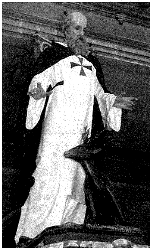
San Gwann de Matha

għaliex meta huma minn Franza marru Ruma jitolbu lill-Papa Innoċenzju III għall-approvazzjoni ta' l-Ordni tat-Trinitarji u l-Papa beda jaħsibha li seħħet haġa mirakoluża oħra. Ġara li l-Papa Innoċenzju III kien qed iqaddes il-quddiesa u f'daqqa waħda lemaħ huwa wkoll id-dehra ta' l-anglu bl-ilbies abjad bis-salib blu u aħmar fuq sidru u b'żewġ ilsiera f'riġlejh. Is-sema kien tkellem u l-Papa ta l-approvazzjoni tiegħu. Minn dakinhar 'il quddiem l-irħieb Trinitarji bdew iġibu fuq sidirhom fil-libsa tagħhom bajda s-salib aħmar u blu. Is-salib b'dawn iż-żewġ kuluri sar