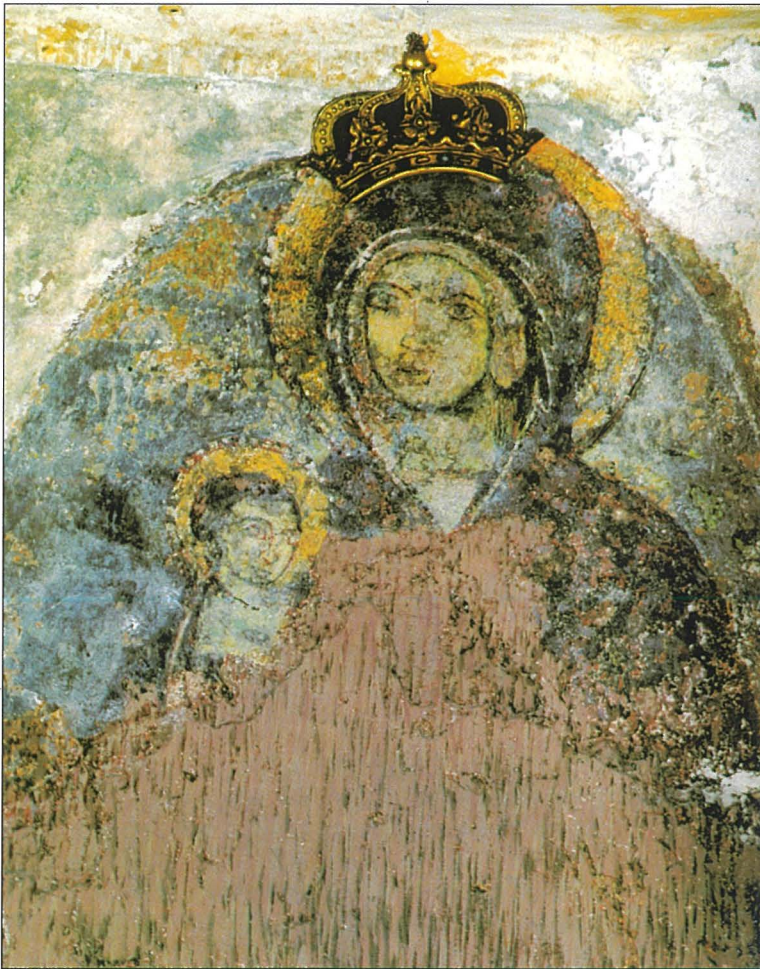
L-Ikona tal-Madonna tal-Mellieħa (sekl u 11-12)