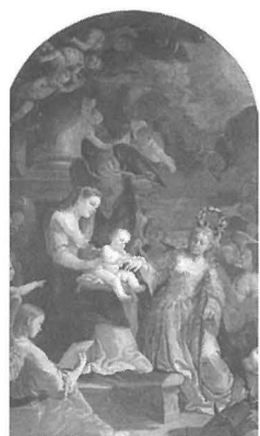
Kappella tal-Italja Kon-Katidral - Valletta

Id-devozzjoni lejn Santa Katerina kienet imxerda f'diversi rħula f'Malta. Fis-seklu XII, twaqfet knisja oħra f'Hal Qormi li għadha hemm