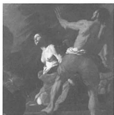
Mużew Nazzjonali tal-Arti - Valletta