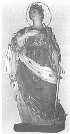
Knisja Parrokjali San Lawrenz - Birgu