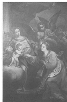
Monasteru Sta. Katarina - Valletta