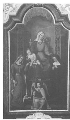
Monasteru Sta. Katarina - Valletta