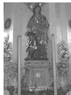
Monasteru tas-Sorijiet Agostinjani - Valletta