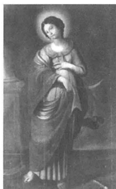
Knisja Parrokjali Sigġiewi