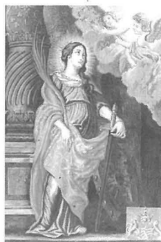
Id-Daħla ir-Rabat - Malta

Fil-Qrendi hemm knisja oħra fil-lok imsejjaħ Tat-Torba, li aktarx kien post tad-dfin. Nafu