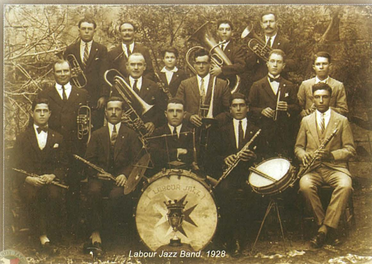
Labour Jazz Band, 1928

Fit-tielet laqgħa tal-Kumitat il-ġdid tal-Partit tal-Haddiema li nżammet nhar it-18 ta' Mejju 1927 ġie deċiż li tintbagħat il-lista tal-Kumitat Distrettwali sabiex ikun