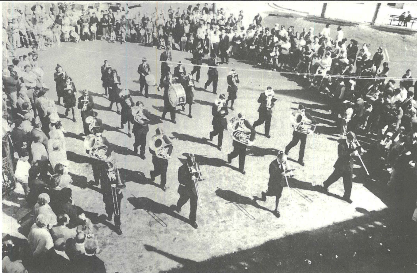
!!-Warrington Youth Band waqt marċ fil-pjazza quddiem il-każin.

Minn qalbi u f'isem sħabi kollha nizżiħajr lil dawk kollha li b'xi mod jew iehor tawna l-ġhajnuna tagħhom. L-ġhajnuna u l-ħeġġa tagħhom fisret kisba oħra artistika li żgur li ser tkun ta' unur għal kull min offra l-kontribut tiegħu biex titlesta opra li ssir aktar prezzjuża aktar ma jgerbu s-snin.