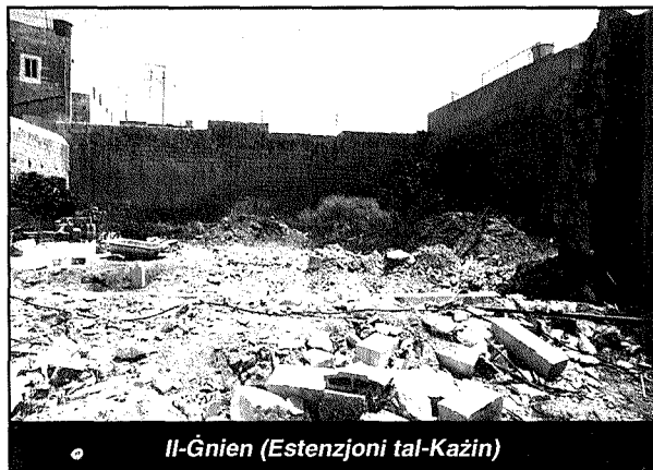
Il-Ġnien (Estenzjoni tal-Każin)

Batew il-membri shabna ta' qabilna. Ma setax jonqos. Fl-ewwel snin tal-hajja tagħha s-Socjeta`