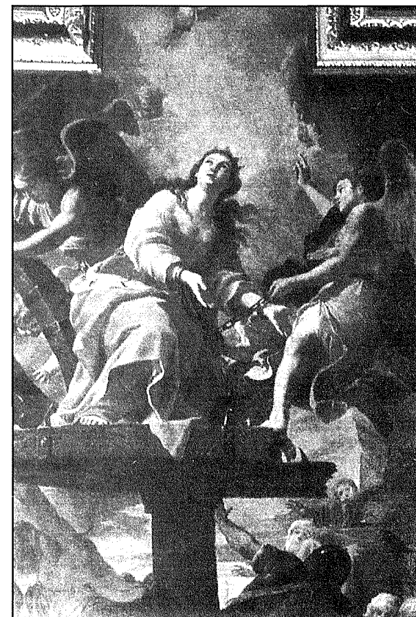
Mattia Preti, "Santa Katarina mehlusa mill-qilla tar- rota", kwadru fil-knisja parrokkjali taż-Żurrieq.

Dan li jagħmel sabiha lir-riċerka storika: li jirnexxielna nitghallmu affarijiet li qabel qatt ma nkunu smajna bihom.