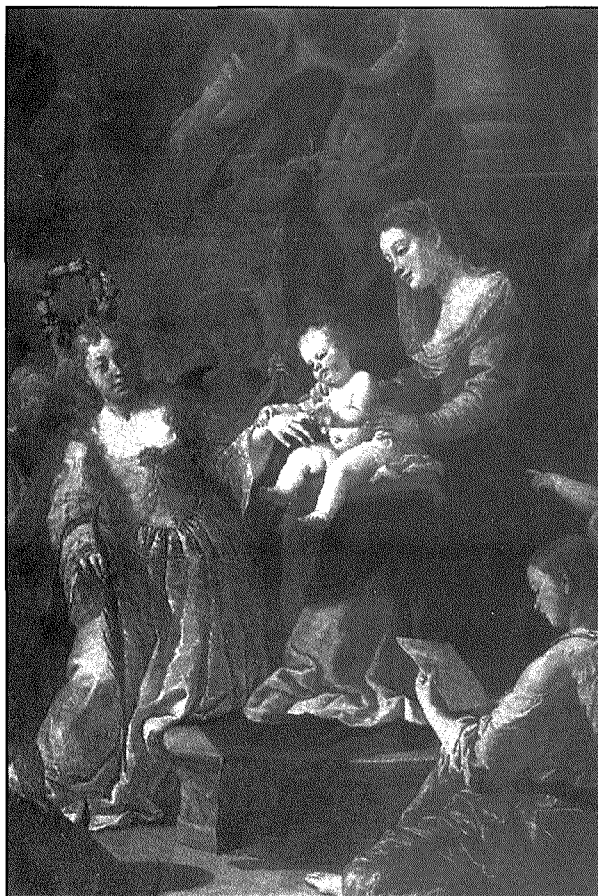
Mattia Preti, "L-Gherusija ta' Santa Katerina", Kwadru fil-Kon Kattidral ta' SanĠwann, il-Belt Valletta.

ta' l-ispettatur in-naha t'isfel, u l-libsa dehebiena ta' Santa Katerina, hu emfasizzat fuq is-sema kahlani. Il-qaddisa tidher f'mument ta' komunikazzjoni serena mal-Hallieq tagħha. Il-harsa tieghek hi diretta 'l fuq lejn il-figura ċentrali ta' Santa Katerina. Veru li l-figuri jimlew il-kwadru kollu, iżda l-pittur irnexxielu bl-użu tad-dellijiet jiżola l-figura tal-qaddisa martri mill-personaġġi l-oħra.