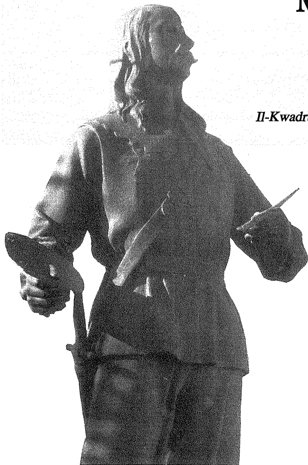
Statwa ta' Mattia Preti fl-Italja. Hu ghex f'Malta għal bosta snin u miet eżattament 300 sena ilu.

B halissa qeghdin isiru f'Malta u wkoll barra minn Malta, diversi attivitajiet biex ifakkru għeluq it-300 mitt sena mill-mewt tal-famuż pittur Taljan Mattia Preti, li miet eżattament fit-3 ta' Jannar 1699, wara li l-ahhar 38 sena minn hajtu għaddihom f'Malta, fejn ukoll miet. Jinsab midfun fil-Kon Kattidral ta' San Ġwann, il-Belt Valletta.