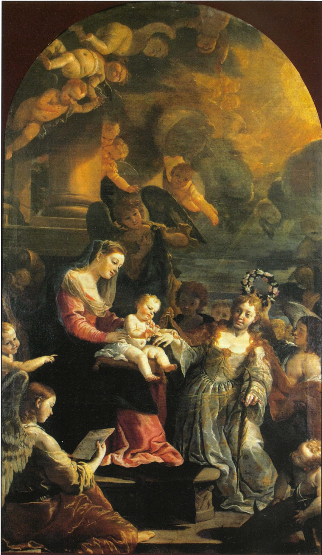
Iż-żwieġ mistiku ta' Santa Katerina fil-kappella tal-Kavallieri ġol-Katidral ta' San Ġwann. Xoghol ta' Mattia Preti (ara paġna 39).