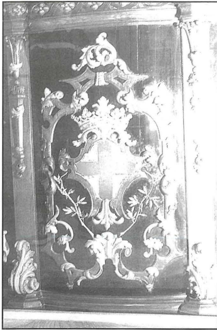
Dettal mill-Bankun ta' Sta Katerina