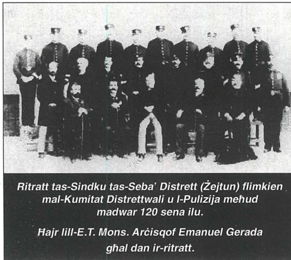
Ritratt tas-Sindku tas-Seba' Distrett (Żejtun) flimkien mal-Kumitat Distrettwali u l-Pulizija meħud madwar 120 sena ilu.

I żda bla dubju ta' xejn kellha tkun Ġużeppina, li twieldet lil Dr. Curmi fil-Belt Valletta fl-1864, li minn fost it-tfal kollha tiegħu, l-aktar li kellha tagħmel ġid fir-raħal taż-Żejtun . Fiż-Żejtun ġibuha tarbija ta' sena u meta tfarfret xebba kienet tghallem il-katekiżmu lit-tfal, l-ewwel fid-dar tal-ġenituri tagħha u mbagħad fil-knisja ta' l-Ispirtu s-Santu. Meta darba marret pellegrinaġġ Lourdes, hi hasset is-sejha reliġjuża u fis-snin ta' wara waqqfet il-Kongregazzjoni tas-Sorijiet ta' Ġesu` Nazzarenu , li għamlu s-snin jieħdu hsieb it-tfal orfni, mhux biss miż-Żejtun, iżda wkoll minn parroċċi oħra. Ġużeppina kellha devozzjoni kbira lejn Ġesu` Nazzarenu, umilta` straordinarja, fiduċja kbira fil-Providenza t'Alla u mhabba profonda lejn il-batuti (15).