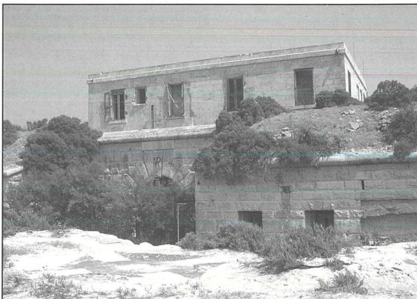
Il-Fortizza ta' Delimara.

Min-naha tas-servizzi nfethet Qorti Marzjali kontra l-fizzjal inkarigat mill-fortizza ta' Delimara, akkużat talli halla barra l-fortizza balal li kienu tas-servizz li setghu uu kienu perikolużi jew aċċessibbli li jistgħu jintmessu mill-pubbliku. Imma wara l-hafna xhieda li ressaq il-fizzjali li kien ilu li ta r-rapport tiegħu biex dawn il-