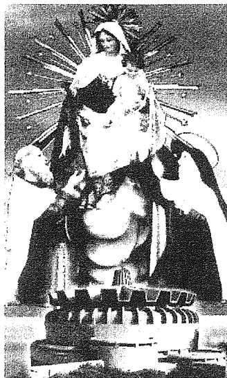
Ta' Santa Tereza gewwa Birkirkara