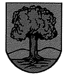
Walzbrych - Poland