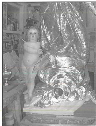
L-Anġlu tal-vara ta' l-Assunta ta' Hal Ghaxaq

Kollox juri li l-intenzjoni ta' Farrugia kienet li din l-istatwa ssib postha fil-knisja parrokkjali ta' Hal Ghaxaq. Il-hsieb jiġi sostnut fit-talba mresssa lill-awtoritajiet tal-knisja lokali fl-1811 biex il-vara ssir propjetà tal-knisja parrokkjali. Fil-fatt l-istatwa mahduma b'mod li tista' titgawda minn angoli differenti waqt pruċissjoni. Ma nafux jekk Girada lestiex l-istatwa kif miftiehem għalkemm is-sena 1808 tissemma minn numru ta' studjużi bħala d-data li fiha żżanznet l-istatwa. Jekk lesta l-vara fiż-żmien stipulat dan hu tabilhaqq kas uniku għaliex Girada rari kien jlesti fiż-żmien miftiehem. Madanakollu, jidher li t-talba lill-awtoritajiet tal-knisja tirreferi għas-sena 1810 bħala d-data li fiha l-istatwa tlestiet. Jista' jagħti l-kas li għalkemm l-istatwa tlestiet fl-1808 ma bdiex tinstilef lill-knisja qabel l-1810. L-ewwel banku jidher li sar fl-1814 mis-surmast