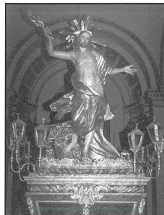
L-Irxox tal-Kollegġjata ta' Bormla