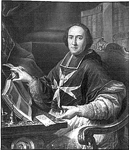
L-Isqof Alpheran De Bussan

legati ma' dan l-artal. Fost dawn insibu s-Sacerdoti Dun Pietro Mallia 8 u Dun Antonio Ellul 9 li b'testamenti li saru fl-1779 u fl-1784 rispettivamente rabtu ammonti ta' flus biex isir quddies għal ruħhom fuq dan l-artal. Ma setax jonqos li fuq l-altar kienet issir il-festa tal-Madonna tal-Karmnu li b' digriet tat-12 ta' Diċembru 1750 mogħti mill-Isqof Alpheran de Bussan, din kellha ssir Hadd fost l-ottava tal-Madonna tal-Karmnu. Fil-Vista pastorali tiegħu, l-istess Isqof jiddokumenta li l-festa kienet issir