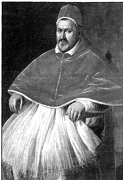
Il-Papa Pawlu V

biex l-assoċjazzjoni tal-Bambin Ġesù tkompli żżid aktar id-devozzjoni diġà introdotta f'din il-Knisja Parrokkjali.