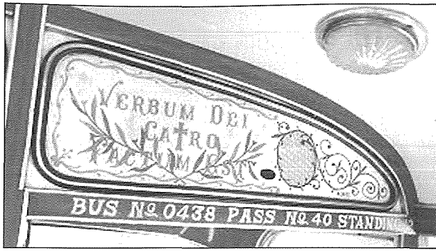
Il-kliem tal-Verbum Dei mpitter f'wahda mill-karozzi tal-linja

izommu l-ġewwieni tal-karozzi tagħhom bi xbihat tal-qaddisin tagħhom u xbihat oħra li jhobbu imma l-aktar haġa popolari tagħhom hija l-kliem latin - "Verbum Dei Caro Factum Est " li xerred il-qaddis