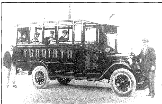
Karozza tal-linja msemmija għall-opra Traviata fl-epoka msemmija mill-awtur

Dawn dehru fostna fi żmien il-Gwerra l-Kbira li bdiet fl-1914. Ilum nafuhom aktarx bl-isem Inġliż,