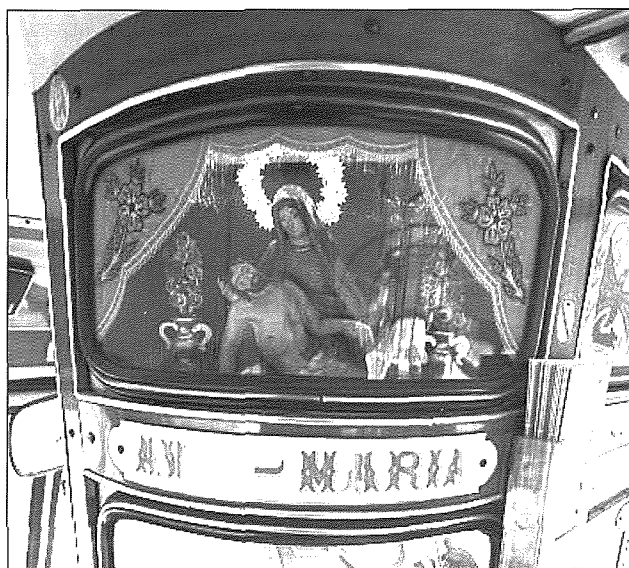
Statwa tad-Duluri f'wahda mill-karrozzi tal-linja li kienu jintużaw dan l-aħħar.

Illum għandna l-karrozzi tal-linja kollha ta' lewn wiehed u jingħarfu bin-numru, imma s-sidien żammew ftit mit-tradizzjoni tal-folklor billi għadhom