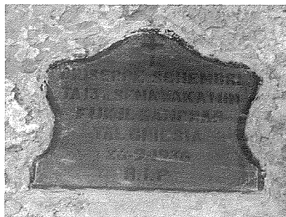
Il-Plakka li tfakkar din il-ġrajja