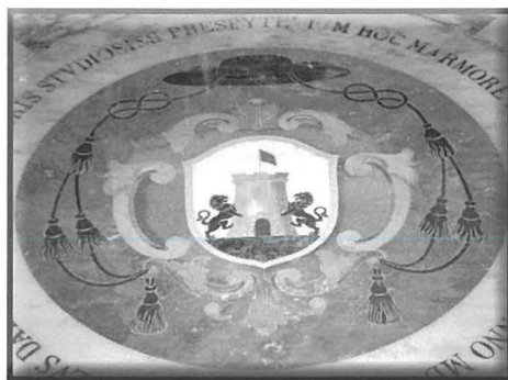
Din tinsab fil-Knisja Parrokkjali tal-Gudja