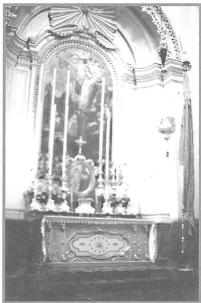
Ritratt antik tal-kwadru

Kif indikat mill-visti pastorali, dan l-artal dejjem kien imwaqqaf għall-qima tal-Madonna taċ-Ċintura però jista' jagħti l-każ li ix-xbieha tal-Madonna kienet tal-Immakulata kuncizzjoni. Din l-ipotesi hija msaħħa mill-fatt li fuq il-lampier, li fl-imghoddi