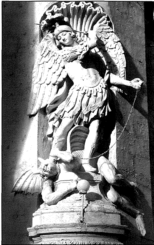
Statwa tal-ġebħa ta' San Mikiel Arkanġlu li tinsab fil-Belt, xogħol l-istess skultur.