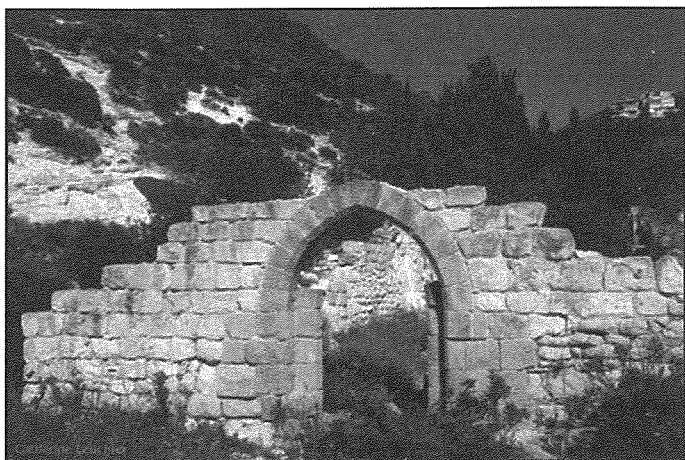
Fdalijiet tal-kunvent ta' l-ewwel Karmelitani fuq il-Muntanja tal-Karmelu c.seklu 13 AD

drabi u bis-skop preċis biex jagħti piż lid-direttivi li jkun qieghed jagħti. Ir-Regola ta' San Albert mhiex twila ħafna fiha 18 il-paragrafu li jtkellmu fuq id-dixxiplina tal-ħajja reliġjuża bħal l-ubidjenza lejn il-pirjol u l-voti ta' safa u l-faqar. Titkellem ukoll fuq l-importanza taċ-ċella, l-kamra tal-eremit li kull wiehed kellu jkollu waħda personali mogħtija lil mill-pirjol skont San Albert din iċ-ċella hija s-santwarju personali tal-eremit li minnha wiehed għandu joqghod lejl u nhar jaħseb fuq il-Liġi tal-Mulej u jishar fit-talb. Ir-Regola tkompli fuq atti komuni bħal ikel u talb u l-qari tal-Iskrittura kuljum ħaġa ġdida għall-eremita f'dak iż-żminijiet. Barra l-pariri u direttivi spiritwali li jagħti San Albert f'din ir-Regola bħat-talb liturġiku, sawm u l-armi spiritwali, jagħti direttiva important ħafna meta jikteb: sabiex ikun aktar adattat l-oratorju għandu jinbena f'nofs iċ-ċelel fih mas-sebħ għandkom tingabru kuljum meta jkun possibli ħalli tisimghu l-quddies. Tajjeb ngħidu li f'dak iż-żmien l-eremiti kienu lajċi u mhux saċerdoti u kellhom jistennew s-saċerdot li għalihom jicċelebra l-quddies. Din id-direttiva ta' San Albert turi kemm hu ried li l-ħajja tal-eremiti fuq il-Karmelu tkun iċċentrata fuq Ġesu' u l-liturġija!