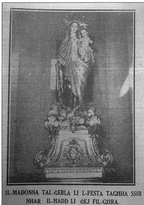
IL-MADONNA TAL-ĠEBBLA LI L-FESTA TAGĦHA SSIR NĦAR IL-ĦADD LI ĠEJ FIL-GŻIRA.