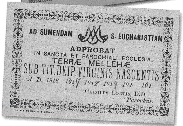
Bulettini tal-Parroċċa tal-Mellieha