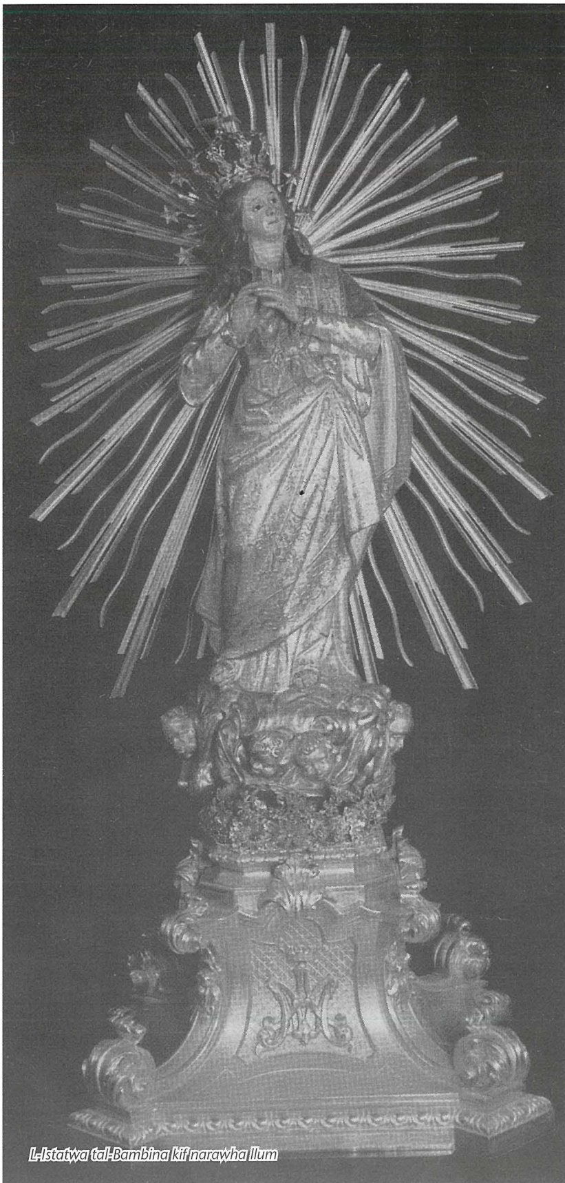
L-Istatwa tal-Bambina kif narawha illum

statwi ta' l-injam maħduma minnu tul hajja ta' aktar minn tmenin sena. 11 Fost dawn insibu statwi tal-Ġimgħa l-Kbira, San Ġorġ u San Ġwann Battista f'Għawdex, Sant'Agata, San Mikiel, San Ġużepp, il-Madonna taħt diversi titli u l-Eżaltazzjoni tas-Salib. Reċentement sirna nafu li l-istatwa ta' San Felicissimu meqjum fil-parroċċa ta' Fhal Luqa u li fiha partijiet mill-ġisem qaddis tiegħu hi xogħol ta' dan