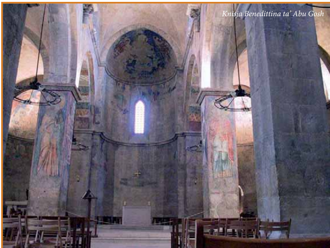
Knisja Benedittina ta' Abu Gosh