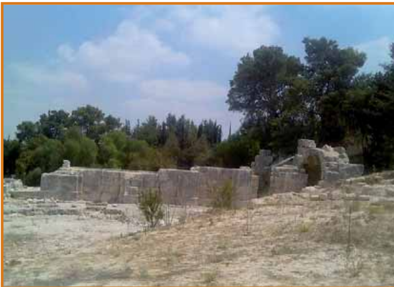
Sit arkejoloġiku ta’ Emmaws Nikópolis