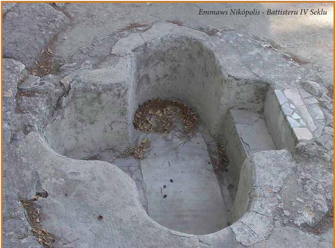
Emmaws Nikópolis - Battisteru IV Seklu

El-Qubeibeh, li hu bogħod 65 stadju (12 km) minn Ġerusalem. Ir-rahal jinsab fuq ix-xaqliba tal-Punent ta' Ġerusalem, qrib l-għolja ta' Nabi Samwil (890 metru), fejn jinsab iċ-ċenotafju tifikira tal-Profeta Samwel. Din hi l-oghla quċċata madwar Ġerusalem, u l-Kruċjati kienu jsejthulha Mons Gaudii , il-muntanja tal-ferh, għax minn fuqha kienu jilmhu għall-ewwel darba l-belt il-qaddisa ta' Ġerusalem. F'Emmaws El-Qubeibeh il-Kruċjati sabu fortizza Rumana, li huma kienu jużawha u semmewha Castellum Emmaus . Huma bnew knisja hemmhekk. Maġenb il-knisja tal-Manifestazzjoni ta' Ġesù lid-dixxipli Kleofa u Xmun, hemm fdalijiet ta' triq Rumana, u rovini ta' bini tal-Kruċjati,