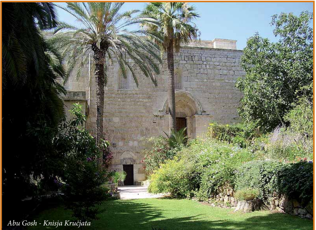
Abu Gosh - Knisja Kruċjata

l-"ahwa tal-Mulej" li jissemmew f'Matthew 13,55: Ġakbu, Ġużeppi, Xmun u Ġuda, jistghu joffrulna l-hjiel biex inholu l-misteru dwar min kienu d-dixxipli ta' Emmaws. Nafu minn Egesippu li Ġakbu "hu l-Mulej" kien l-ewwel isqof ta' Ġerusalem, u gie martirizzat fis-sena 62. Is-suċċessur tieghu bhala isqof ta' Ġerusalem kien Xmun, bin Kleofa. Ġwanni 19,25 isemmi lil "Marija ta' Kleofa", li tista' tigi meqjusa bhala "oht omm" Ġesù, jigifieri oht il-Verġni Marija. Kleofa ghaldaqstant kien iz-ziju ta' Ġesù, u Xmun kien ibnu, jigifieri kugin ta' Ġesù. L-istess kienu Ġakbu, Ġużeppi u Ġuda. Egesippu jfakkar il-martirju ta' Kleofa fi żmien il-persekuzzjoni ta' Trajanu. L-istorja tieghu giet mgħoddija lilna minn Ewsebu ta' Ċesarija fir-IV seku.