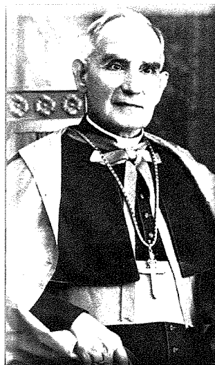
Dun Karm Psaila – l-awgur tal-innu sabiħ 'Nadurawk, ja Hobz tas-Sema'.