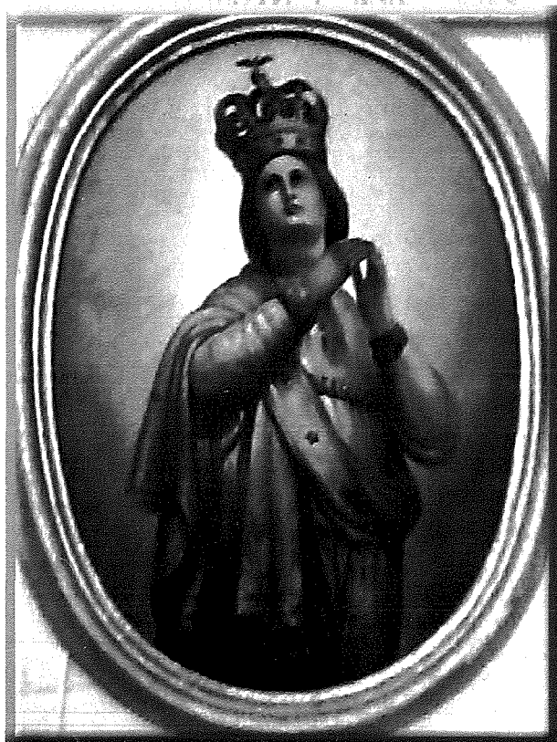
Il-Kwadru tal-Bambina li jinsab fl-Oratorju tal-Parroċca

“Marija Bambina! Kemm int ħelwa, kemm int sabiħa...sraqtilna qalbna...sa minn mindu konna żgħar. Fuq hoġor ommna tgħallimna nsejħulek,