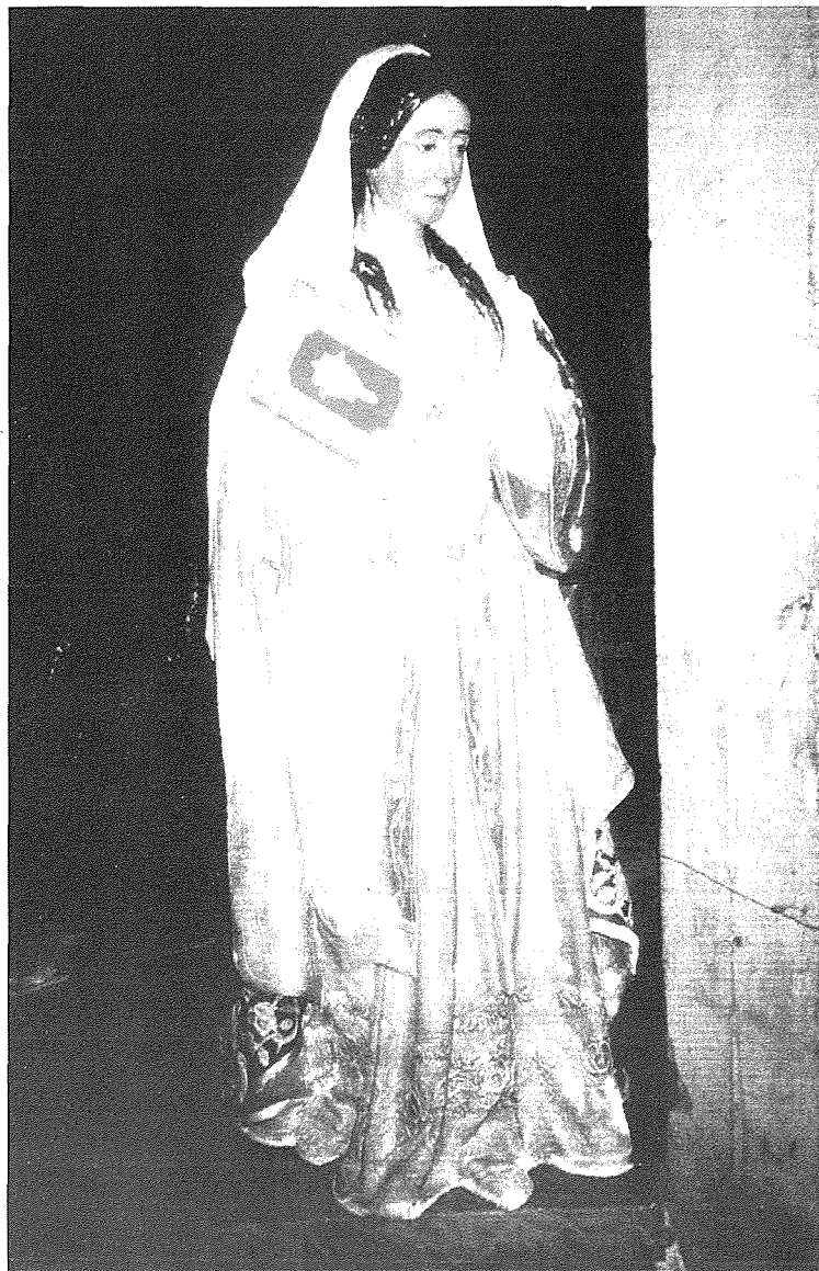
L-istatwa l-antika tal-Madonna tad-Duttrina fin-Naxxar. Illum tinsab esebita fil-mużew tal-parroċċa

Il-festa tal-Madonna tad-Duttrina fin-Naxxar ghalkemm hi wahda sekondarja, jidher li dejjem qajmet interess speċjali f'dan ir-rahhal. Dan minhabba l-interess kbir li dejjem hadu l-prokuraturi ta' din il-festa sabiex ikatru d-devozzjoni lejn Ommna Marija taht dan it-titlu.