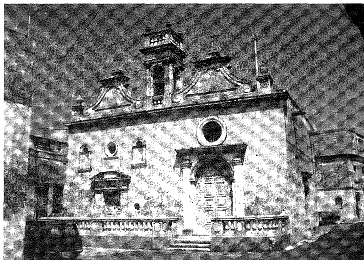
Il-Kappella ta' Santa Luċija fejn sa l-1962 kienet tinżamm il-vara tal-Madonna tad-Duttrina.