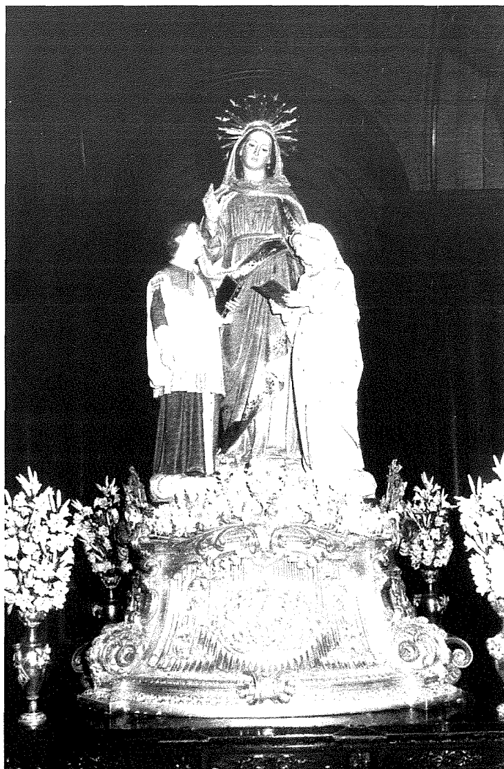
L-istatwa tal-Madonna tad-Duttrina tan-Naxxar saret f'Marsilja fis-sena 1893.