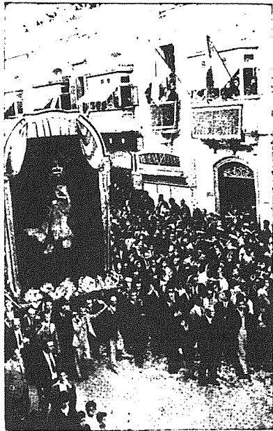
Il-kwadru titulari tal-Kuncizzjoni quddiem il-Kazin San Gejtanu tal-Hamrun waqt il-pellegrinaġġ li kien sar fid-19 ta' Novembru, 1944.

Rajt irgiel mgħola hawn bidmugħ nieżel ma' wiċċhom. Rajt spetturi tal-pulizija jgdmu xufftejhom biex iżommu d-dmugħ. Kemm għandna għax niringrazzjaw l-Alla li tana saħħitna u s-saħħa ta' wliedna.