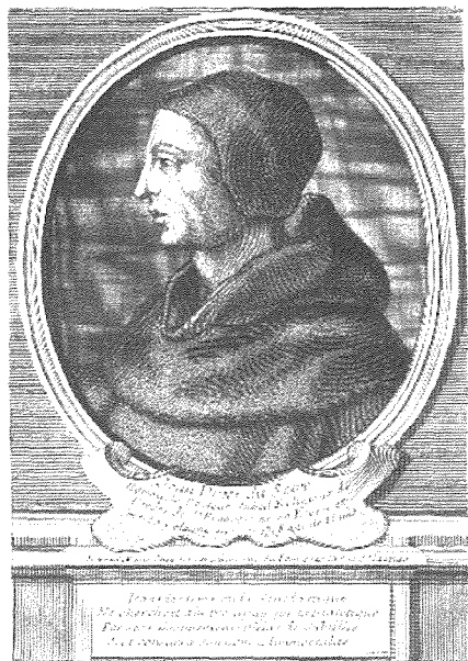
Il-Beatu Ġwanni Duns Scotus

iddikjara li Marija kienet hielsa mid-dnub, imma ma qalx jekk kinetx ukoll mehlusa mid-dnub oriġinali.