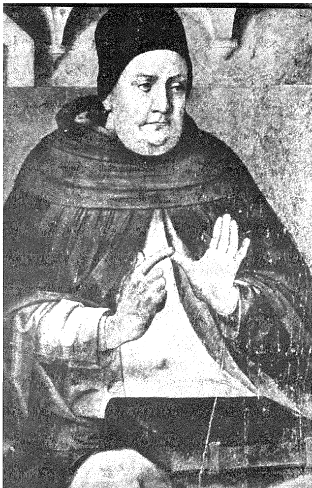
San Tumas t' Aquino

Għad li d-definizzjoni ta' din id-domma hija relattivament riċenti meta mqabbla ma' l-elfejn sena ta' storja li għandha l-Knisja, it-twemmin f'dan il-misteru jmur lura ferm aktar minn hekk. Sa mill-ewwel sekli, fi tradizzjoni bla qtugh u f'ċirkustanzi li mhux dejjem kienu faċli, l-insara