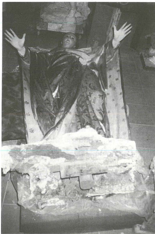
L-istatwa tal-Madonna tad-Duttrina, wara li nqalghet minn fuq il-platform antik, biex titpoġġa fuq wiehed ġdid.

Fit-18 ta' Lulju, 2000, jiġifieri jumejn fuq il-festa, l-istatwa ttiehdet fl-istudjo ta' Renzo Gauci, fi Triq il-Fieres, fejn hu seta' jeżamina aktar bir-reqqa l-hsarat li kienu ġew innutati. B'dan il-mod, seta' jippjana x-xogħol li kien hemm bżonn isir.