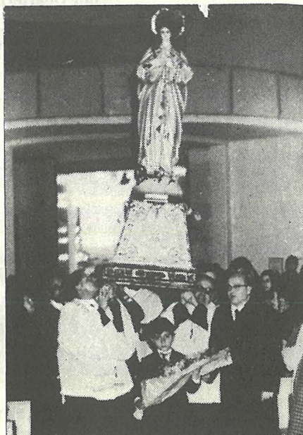
Il-wasla ta' l-ewwel vara titulari ta' Marija Immakulata