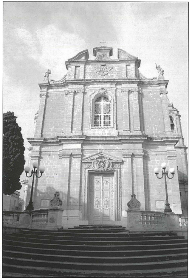
Il-Faċċata barokka tal-knisja, fiġhed l-influwenza ta' Lorenzo Gafà fuq il-periit Sebastian Saliba.

Normalment iċ-ċerimonja kienet tkompli bit-translazjoni tar-relikwi tal-matri. Għalhekk kienet toħroġ purċissjoni mill-knisja sal-post fejn kienu miżmuma r-relikwi minn ġurnata qabel. Ir-relikwi kienu jingarru minn erba' djakni libsin dalmatika hamra fuq bradella żgħira. Warajhom kien jimxi l-Isqof u l-kongregazzjoni kollha. Mal-wasla lura l-knisja kienet tibda iċ-ċerimonja tal-konsagrazzjoni tal-artal maġġur. L-Isqof kien ipogġi r-relikwi taht il-mensa tal-artal. Wara l-artal kien jindilek bil-balzmu waqt li żejt u incens kienu jinharqu bl-akkumpanjament ta' kant mis-sacerdoti. Fl-aħhar kienet tinfirex terha tal-harir fuq l-artal. Dan kien iwassal għat-tmiem taċ-ċerimonja.