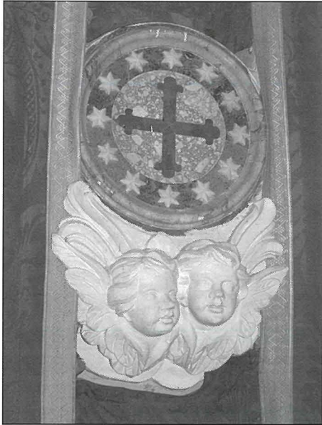
Wieħed mis-slaleb tal-konsagrazzjoni. Minn dawn kull knisja għandha 12. F'Hal Għaxaq dawn is-slaleb huma mzejna b'par puffini mnaqqxa fil-ġebel, kull par differenti minn ieħor.

Wara kien jibda tberik tal-hitan minn ġewwa waqt il-kant tas-salmi. Dan it-tberik kien iwassal għad-dlik tas-slaleb tal-konsagrazzjoni. Dawn is-slaleb jirrappreżentaw it-tnax-il appostlu. Bhal ma l-appostli huma s-sisien tal-Knisja Kattolika, hekk ukoll l-islaleb tal-konsagrazzjoni ikunu mwahhlin mal-pilastru maġġuri tal-knisja li jzommu l-knisja b'saħħitha u fuq saqajha. Dawn is-slaleb kienu jindilku mil-Isqof b'tahlita ta' żejt u balzmu. Din it-tidlika tfakkarna fl-antik testment meta nies kienu jiġu kkonsagrati lil Alla permezz tad-dlik biż-żejt imbierek u l-balzmu.