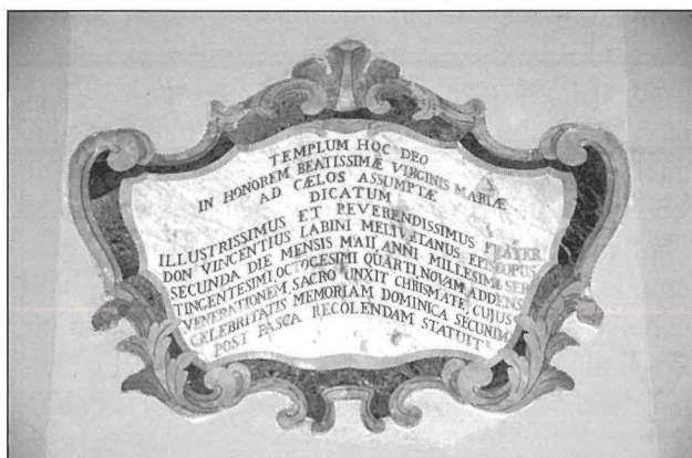
Lapida tal-irħam interzjat li tfaċċar il-Jum tal-Konsagrazzjoni tal-knisja ta' Hal Għaxaq. Din fimsab fuq il-Pilastru maġġur faċċata tal-artal Maġġur.

Nhar it-2 ta' Mejju 1784 kien jum importanti hafna għall-komunita Għaxqija. Kien il-jum li fih il-poplu Għaxqi ra wahda mill-holmiet tiegħu ssir rejaltà. Kien il-jum li fih l-Isqof Vincenzo Labini, fil-preżenza tal-kleru tal-parroċċa u l-poplu kollu Għaxqi, ikkonsagra l-knisja parrokkjali 1 . Dan kien, u għadu, rit importanti hafna għall-insara, għax jimmarka l-bdil ta' binja, f'maqdes u post ta' qima lejn Alla. Imma fuq kollox, il-konsagrazzjoni tal-knisja timmarka solennement li dak huwa l-post fejn jgħammar il-Mulej fil-misteru tas-sagrament tal-Ewkaristija u b'hekk jagħmel il-knisja d-dar ta' Alla fuq l-art.