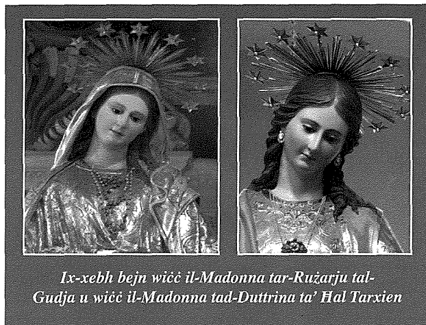
Ix-xebh bejn wiċċ il-Madonna tar-Rużarju tal-Gudja u wiċċ il-Madonna tad-Duttrina ta' Hal Tarxien