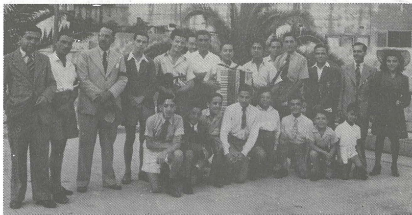
Membri tax-Xirka tal-Malti għat-Tfal li organizzaw Akkademja Mużiko-Letterarja fil-Każin tal-Banda San Gejtanu tal-Hamrun fil-15 ta' Settembru, 1945 (l-awtur ta' l-artiklu jidher kokka r-raba' mix-xellug).

habta konna mmorru sabiex inxandru l-programmi tagħna min- Knight's Hall (illum nafu l-post bħala Dar il-Mediterran ), fejn kien hemm l-istudios tax-xandir tar- Redifusion .