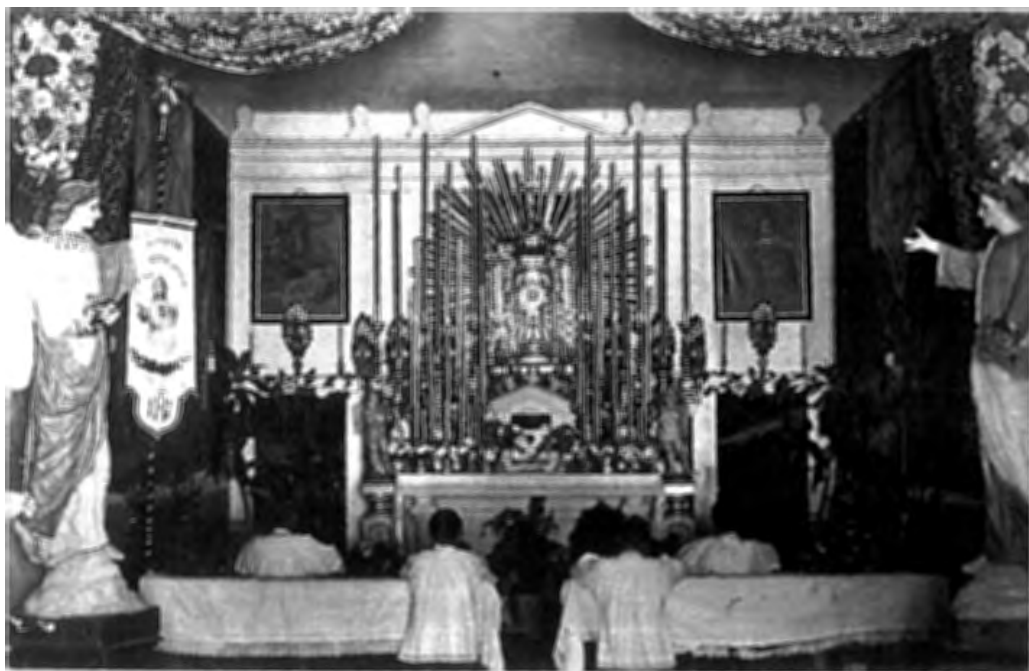
Il-kappella tal-Oratorju kif kienet tkun armata waqt il-festi kbar fi żmien meta l-Oratorju kien stabbilit fi Triq il-Parroċċa bejn l-1922 u l-1935. Jidhru t-tfal għarkopptejhom quddiem is-sagrament espost u l-bandalora l-antika tal-Oratorju fuq ix-xellug.