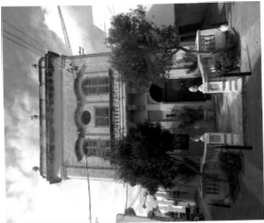
Il-binja fi Triq il-Parroċċa wara r-Rotunda li serviet bhala sede għall-Oratorju Qalb ta' Ġesù bejn l-1922 u nofs it-tletinijiet sakemm beda jintuża l-Oratorju fejn nafuh illum. Din id-dar kienet originarjament id-dar ta' Dun Felice Calleja, il-kapillan li holom u beda jwettaq il-proġett tar-Rotunda fl-ewwel kwart tas-seklu 19.