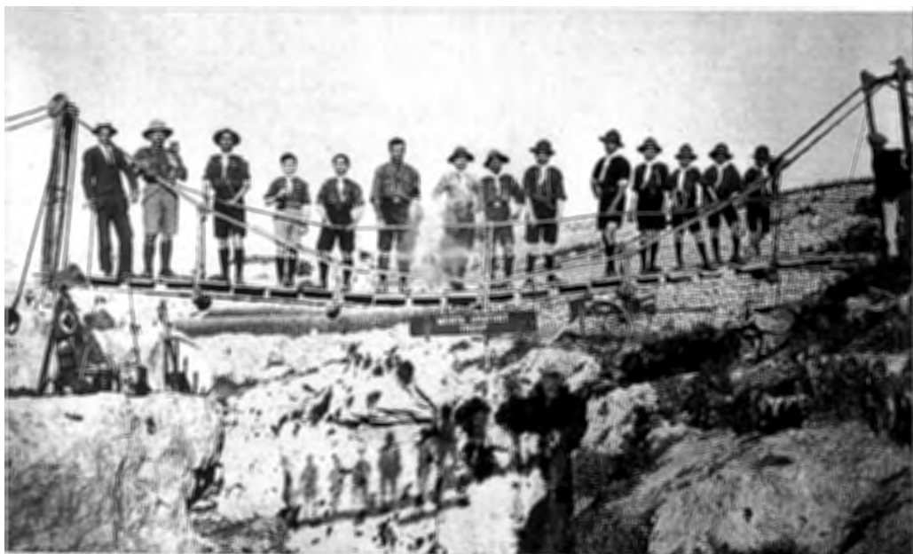
Pont proviżorju armat bl-injam u l-ħbula magħmul mill-iscouters Mostin fil-Wied tal-Isperanza, il-Mosta nhar il-festa ta' Lapsi tal-1920. Tispikka t-tabella mwahħla f'nofs il-pont, Musta Oratory Troop , li kien l-isem uffċjali tal-iscouters Mostin bejn 1916 u 1922.