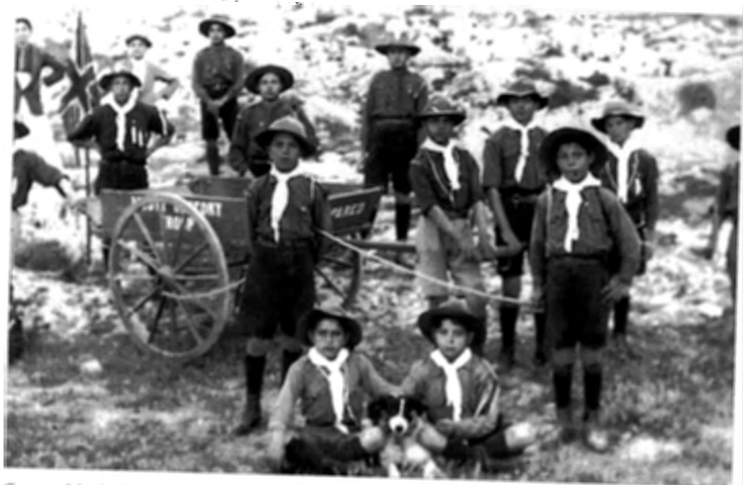
Scouters Mostin tal-Oratorju waqt attività fil-widien għall-habta tal-1917. Fuq il-karettun hemm il-kliem, Musta Oratory Troop , xhieda tar-rabta bejn l-Oratorju Qalb ta' Ġesù u l-moviment tal- Boy Scouts fil-Mosta