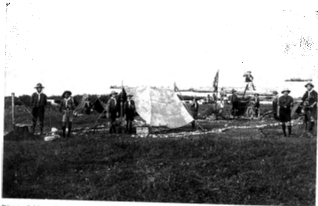
Ritratt tal- Musta Oratory Troop tal-1917 li kien jintuża bhala postcard fejn dak li jkun seta' jikteb xi kelmtejn qosra fuq wara u jibagħtu bil-posta. Jidhru l-kampijiet sinonimi mal- iscouts li sal-lum għadhom jimxu bil-motto ' be prepared '.