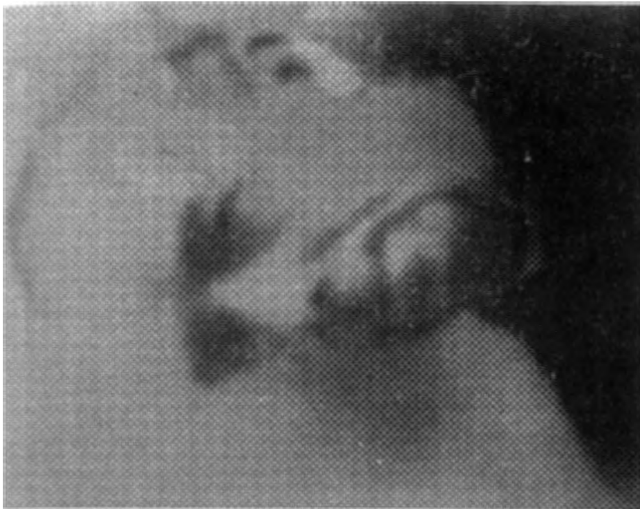
Il-Mosti Dun Karm Gauci, fundatur tal-ewwel Oratorji fil-Mosta, wiehed għas-subien u ieħor għall-bniet. It-tnejn fetiħhom fl-1914; tas-subien fis-7 ta' Ġunju waqt li tal-bniet fit-13 t'Awwiissu.