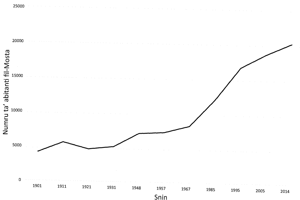
Grafika 8.2: Il-popolazzjoni tal-Mosta bejn 1901 u 2014