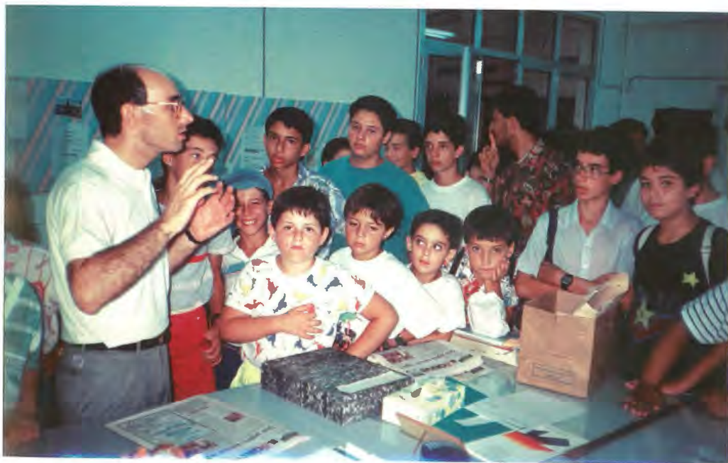
Harga għat-tfal tas-Summer Project tal-1991 meta żaru l-istamperija tal-Knisja fil-Blata l-Bajda. Hawn naraw wiehed mill-ġurnalisti ta' IL-ĠENS , li kienet il-gazzetta stampata uffiċjalment mill-Knisja f'dik il-habta, jispjega x-xogħol relatat mal-istamperija.