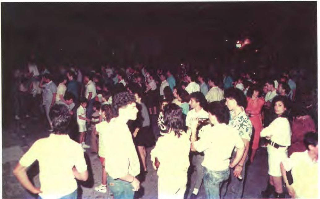
Għall-festa tal-Qalb ta' Ġesù fl-Oratorju kienu popolari l-famużi diskos fuq iz-zuntier. Kien ikun hemm hafna zghazagh Mostin u mhumiex. Kienu jsiru s-Sibt u l-Hadd fighaxija. Dan ir-ritatt ittiehed waqt id-disko tal-festa tal-1989.