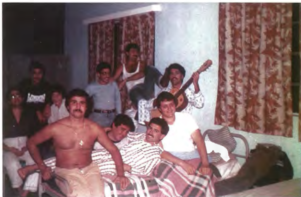
Waqt live-in fis-Sajf fl-1982, bil-partecipazzjoni tal-membri tal-Ġuvintur Azzjoni Kattolika fid-dar taż-Żgħażaġh Haddiema Nsara f'San Pawl il-Bahar. Min jaf kemm kienu jsiru 'kummiedji' u 'fares' tul dawn il-jiem bogħod mid-dar!