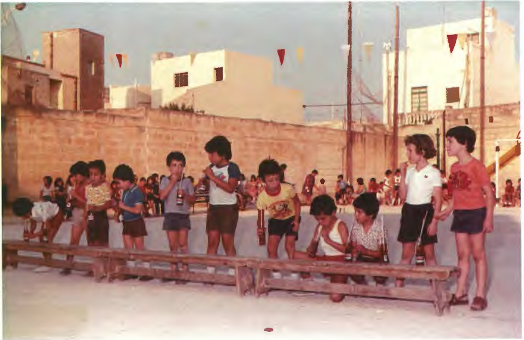
It-tfal waqt il-kompetizzjoni tal-pannina u l- kinnie fl-isports festival tal-Qalb ta' Ġesù fl-1980. Min jiekol u jixrob l-ewwel, jaħrab jiġri saż-zigarella fejn isib lil Dun Ang lest biex jippremjah tal-bravura!