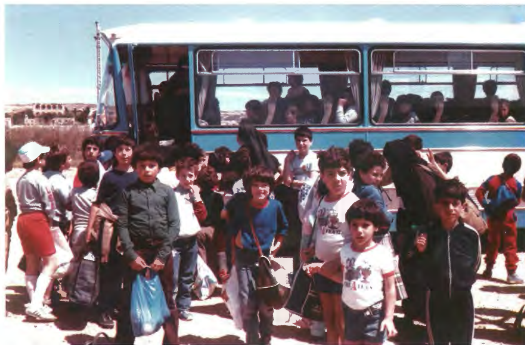
Waqt waħda mill-harġiet matul is- summer school tal-1986. Kulhadd armat bil-basket mimli hobż, xorb u xi biċċa ċikkulata ma tonqosx.