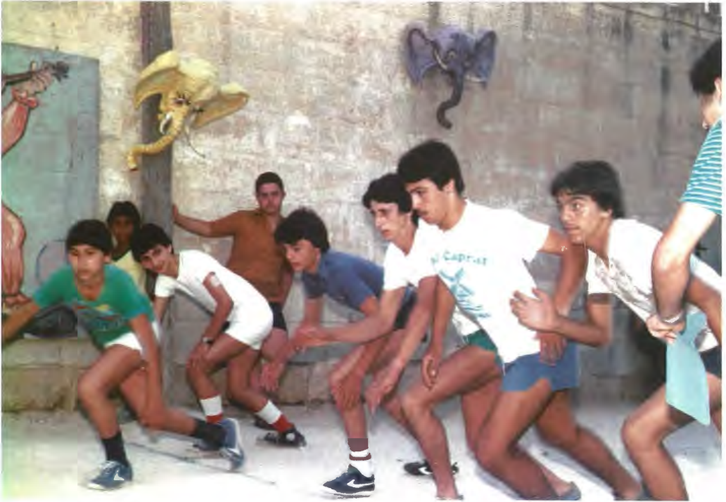
It-tlielaq akkaniti waqt l- sports rally tal-festa tal-Oratorju. Dan ir-ritratt huwa mehud fl-1981. Jidhru wkoll l-irjus tal-iljunfanti fil-kartapesta li kienu jintlibsu waqt l- Elephant Race .