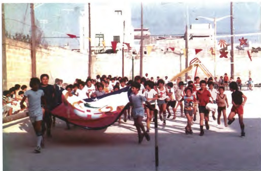
Il-famuża ġirja ta' zewġ dawriet mal-grawnd bil-bandiera tal-Mosta, qabel tittella' mal-antarjol biex tibqa' hemm sakemm jintemm l-isports festival, is-Sibt ta' lejlet il-festa tal-Qalb ta' Ġesù fl-Oratorju.