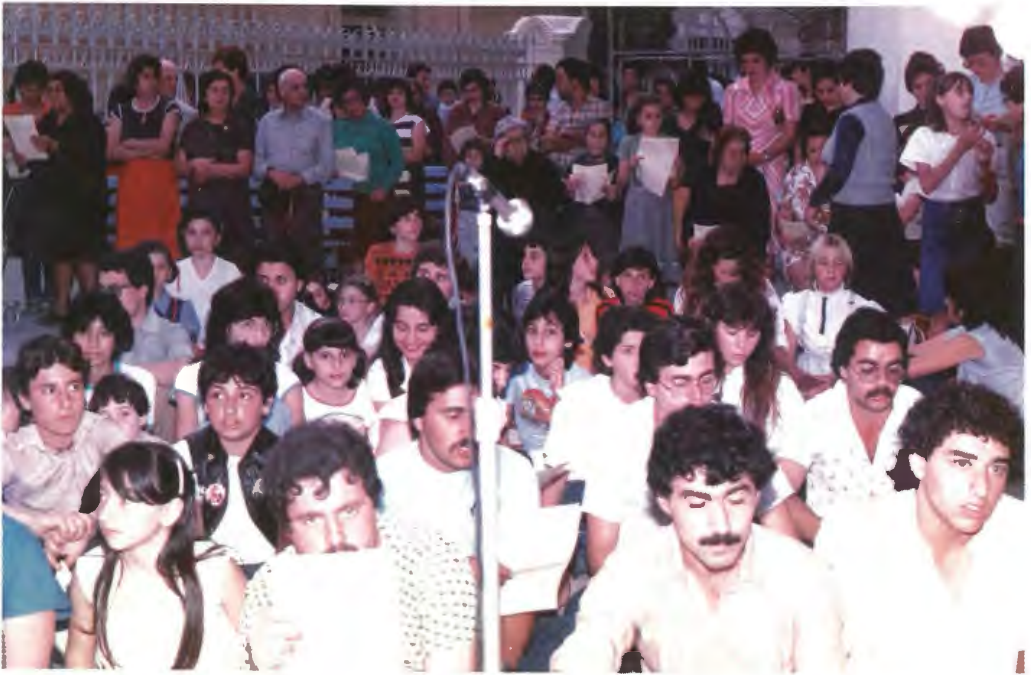
Waqt prayer meeting fuq iz-zuntier tal-Oratorju fl-1983. Iz-zuntier spazjuż tal-Oratorju minn dejjem serva ta' riżorsa tajba biex iż-żgħażaġ Mostin setghu jesternaw l-attivitajiet tagħhom.