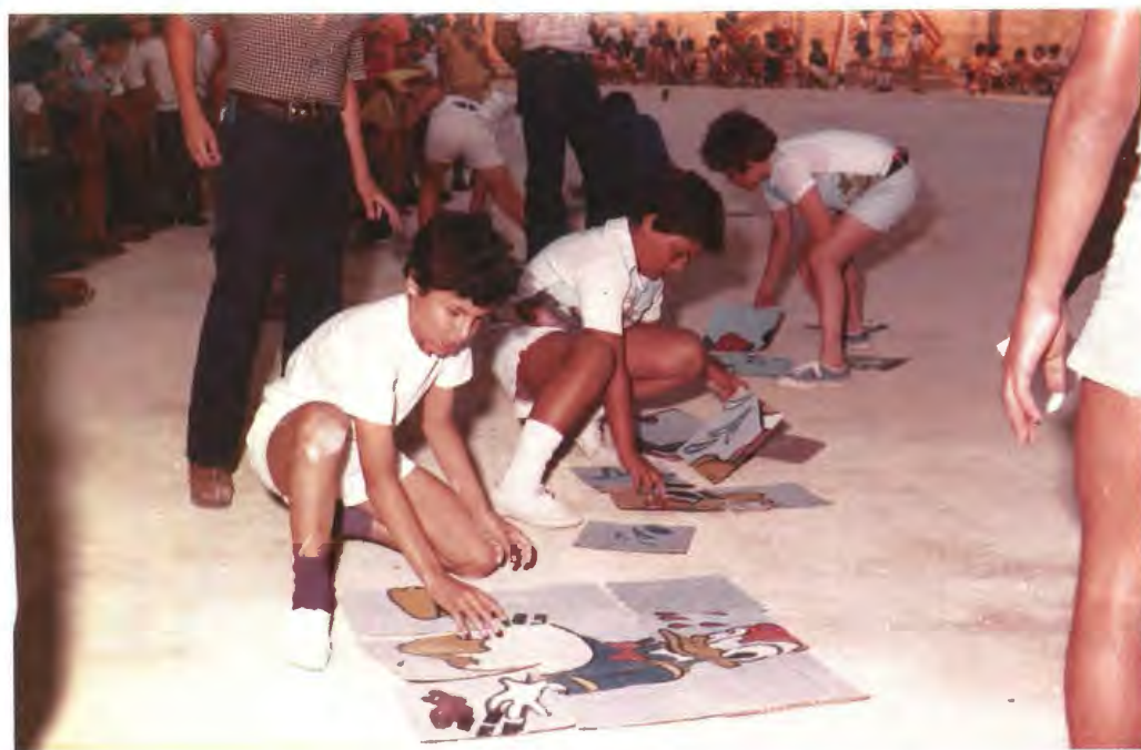
Il-puzzle race waqt ir-rally tal-isports lejlet il-festa tal-Qalb ta' Ġesù tal-Oratorju. Min jgħaqqad l-istampa l-ewwel, jahrab jiġri u jekk jaasal l-ewwel jew it-tieni, imur lejn id-dar b'kaxxa pasti!