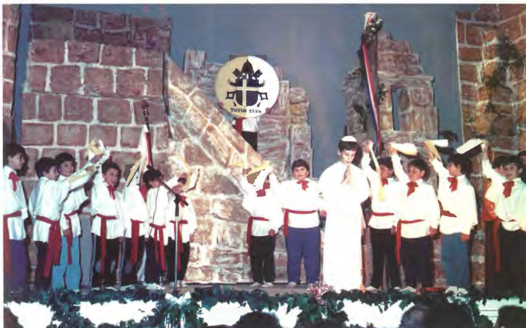
Il-Pueris Cantores waqt il-pageant intitolat, Il-Papa Dalwaqt Fostna , li kien ittella' bhala parti mill-akkademja tal-1990. F'Mejju tal-istess sena l-Papa Ġwanni Pawlu II wettaq l-ewwel żjara f'Malta u hafna minna għadhom jiftakru kif għaddewh sparat mill-Mosta fi triqtu lejn is-Santwarju tal-Mellieha!