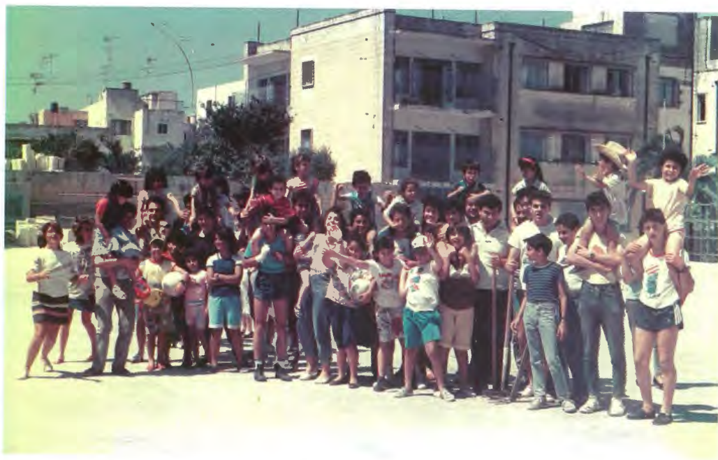
Iż-żgħażaġh tal-Oratorju mdawrin bit-tfal tal-Istitut tal-Orsolini fi G'Mangia nhar is-7 ta' Ġunju 1989. L-Oratorjani kienu jagħmlu ġurnata xogħol volontarju f'dawn it-tip ta' istituti u dejjem kienu jsibu l-hin biex jilgħbu mat-tfal ċkejknin.