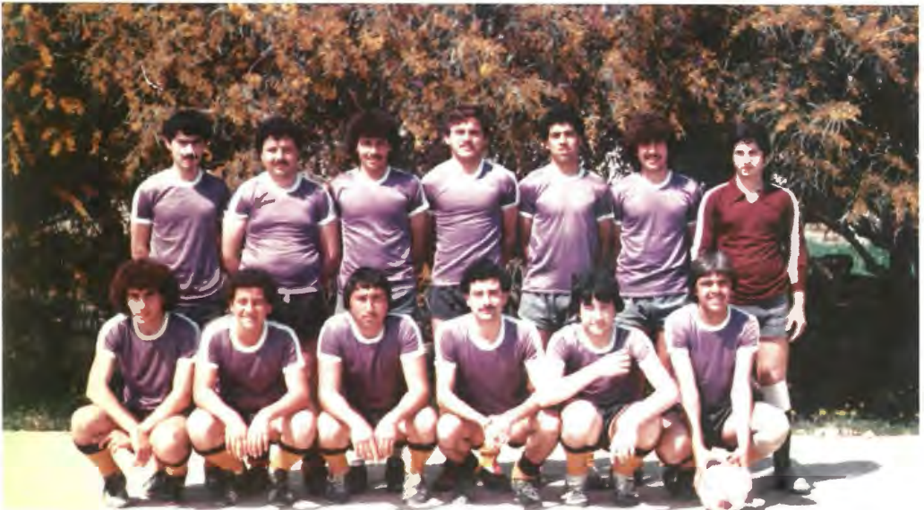
It-tim tal-futbol tal-Ġuvintur Azzjoni Kattolika nhar il-11 t'April 1982. Dakinhar iżżanznu gerijiet vjola għall-ewwel darba. Kienu swew Lm48 (€112).