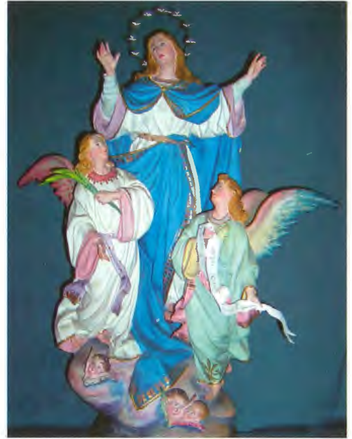
L-istatwetta ta' Santa Marija tal-Oratorju.