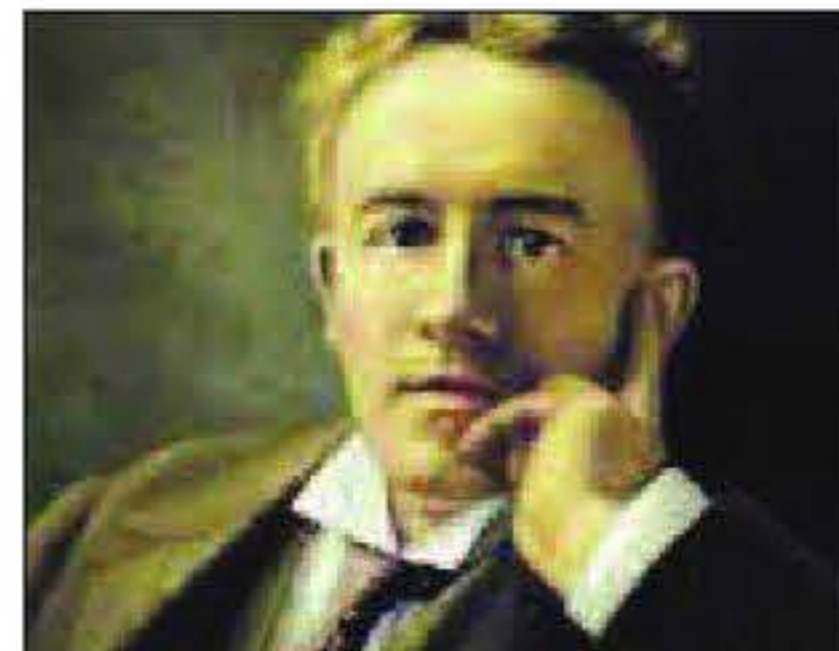
Sir Edward German

Fil-Ħamrun ukoll, ir-reġina għet milqugħa bid-daqq tal-innu Inġliż miż-żewġ baned Ħamruniżi fi pjazza