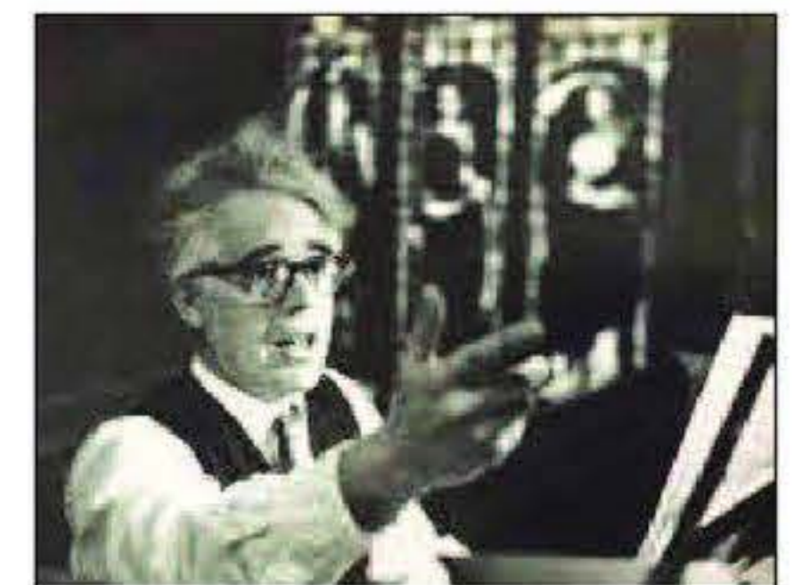
Cedric Thorpe Davie