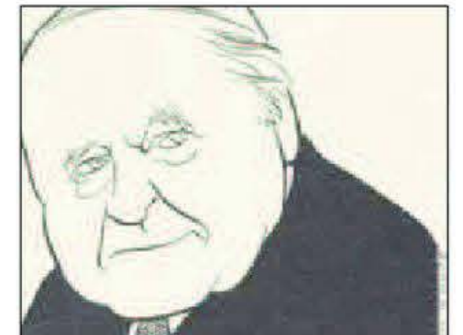
Sir Arnold Edward Trevor Bax

Il-Ġimgħa, imbagħad, 7 ta' Mejju, kien imiss il-baned Ghawdxin biex jilqgħu iż-żjara rjali bid-daqq ta' marċijiet u programmi, u pprezentazzjoni ta' bukketti. Il-baned tal-Kottonera sellmu lir-Reġina fil-wasla u fit-tluq tagħha minn Malta. Il-banda Żabbarija 'San Mikiel' kienet l-ewwel banda Maltija li qatt dehret fit-televiżjoni u nstemgħet iddoqq