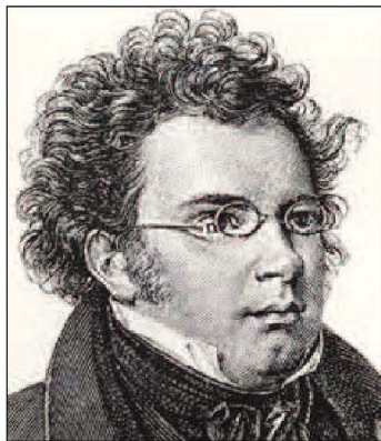
Franz Schubert – l-awtur ta' tliet marči militari

surmastrijiet Maltin għoġbithom l-idea u thajru jiktbu f'dal-istil ferriehi. Ġara li biż-żmien il-marč militari beda jitransforma u jadatta ruhu skont il-hila u t-temperament ta' min jiktbu biex illum għandna dak brijuż.