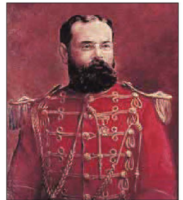
John Philip Sousa