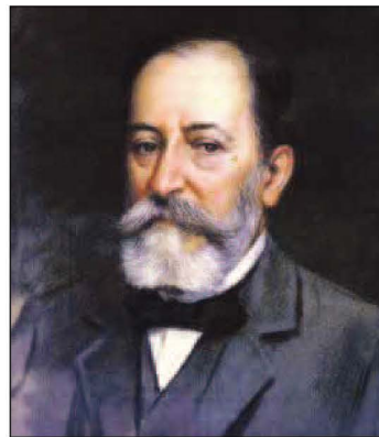
Camille Saint Saens

Fost il-hafna surmastrijiet tat-tieni nofs tas-seklu dsatax li kitbu marči militari għall-baned Maltin insibu tnejn ta' Mro Vincenzo Carabott (1844-1914): Archimede u Calypso . Das-surmast kien surmast-direttur ta' għadd ta' baned, maestro di cappella , vjolinist u kompożitur ta'